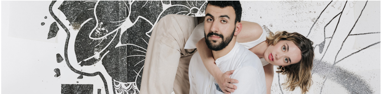
© Sílvia Poch – La Casa de Carlota