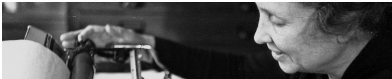
© Her Socialist Smile (2020) dir. John Gianvito