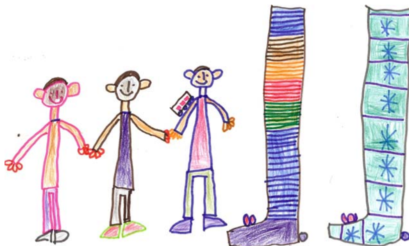
Alumnes de P-4 de l'Escola Cervantes