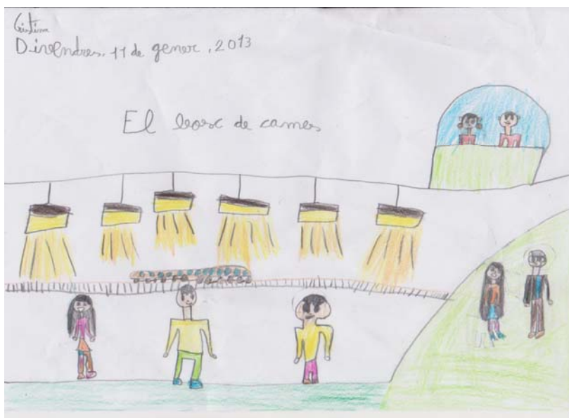
Alumnes de l'Escola Fructuós Gelabert