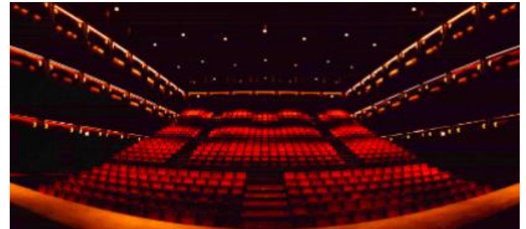
Montjuïc / Sala Fabià Puigserver, capacitat màxima de 720 espectadors