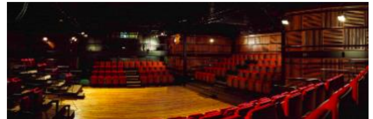
Montjuïc / Espai Lliure, capacitat màxima de 172 espectadors