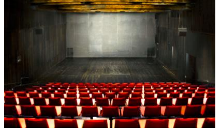
Gràcia, amb una capacitat màxima de 250 espectadors

Inaugurat l'any 2001 com a segona seu del Teatre Lliure, aquest edifici va ser el Palau de l'Agricultura de l'Exposició Internacional de Barcelona de 1929. Les dues sales estan equipades amb una tecnologia que permet canviar de lloc l'escenari i el pati de butaques en pocs minuts, ampliar l'aforament i facilitar els canvis de muntatge.