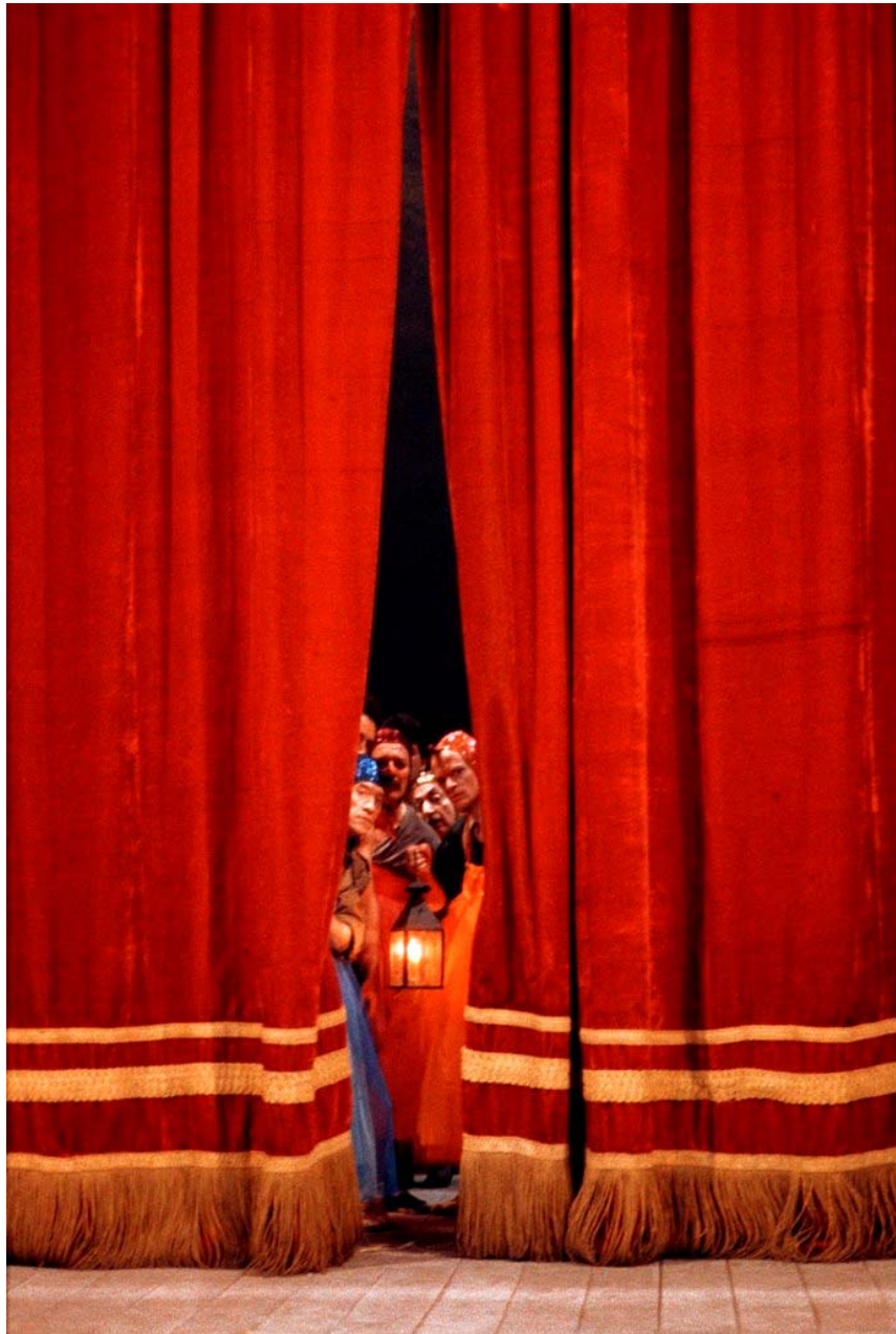
Comedia sin título (1988/89)