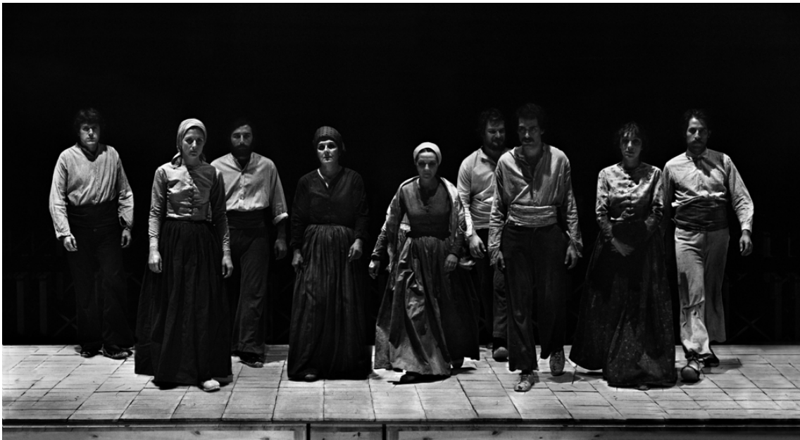
Camí de nit, 1854 (1976)