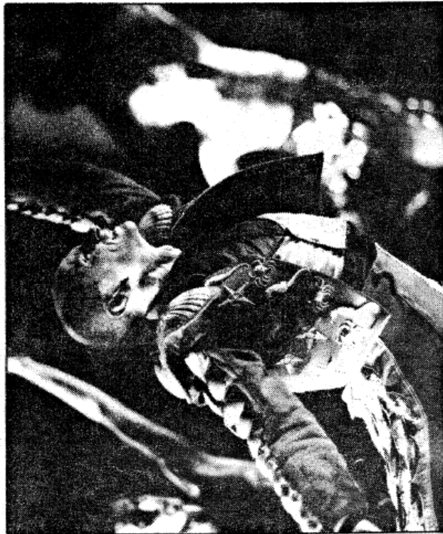
Un espectáculo sobre el mundo de los toros, inspirado en la figura del gran diestro

nal, así como los movimientos que el bailarín impone con autoridad dentro del cuadro coreográfico.