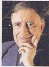
LUIS MARÍA ANSON de la Real Academia Española