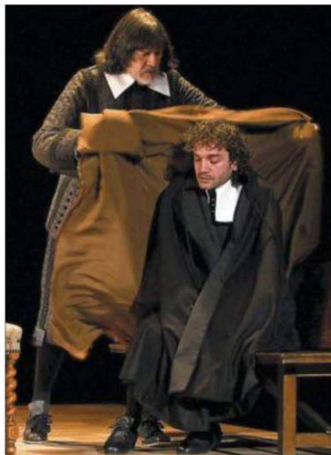
Un momento de El Encuentro de Descartes con Pascal joven.

Pascal, siempre enfermo desde hace años, atormentado por su nueva fe, es la contrafigura del autor de El discurso del método . Nada le da gusto, ni tiene descanso. Ésta es la foto fija que el autor