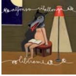
Libérame (K-Industria 2009)