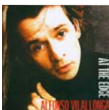
At the edge (Blue Jay Records 1990)