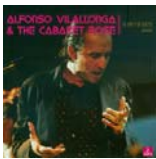
En vivo y en directo (G33G 2006)