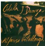
Cábala y danza (G3G 2000)