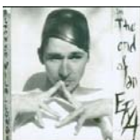
The end of an era (Blue Jay Records 1992)