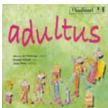
Adultus (Cantata, L'Auditori 2005)