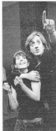
ABC / Una escena de la obra

Como decíamos al principio, enfrentarse a un texto que ya fue cultivado por maestros como Visconti – "Le notti bianche (1957)" – y Bresson - "Cuatro noches de un soñador" (1971)- sin que a uno se le vean las costuras de una forzada aportación original es empresa digna de encomio. Subirós toma el texto de Dostoievsky y lo exprime hasta dejar el extracto seco. Después de intentar reconstruir la vida con retazos de sueños, el narrador acaba recluso en su cotidiana realidad de soledad y pobreza. Habrá de asumir la insoportabilidad de contemplar la felicidad ajena pero, al menos, le quedará el consuelo de haberse sentado, aunque fuera por un instante, en el banquete de amor. Un instante para llenar los sueños de toda una vida. Con su puesta en escena espartana, la directora de "Nits blanques" ha conseguido que un relato primerizo de Dostoievsky condense toda la complejidad de las obras que más tarde cimentarían su posteridad y primacia literaria.