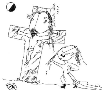
Cucifixión 1 (1925) dibuix de Salvador Dalí