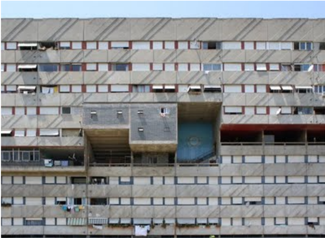
Corviale de Mario Fiorentino. Roma .....

El llenguatge és la capacitat de l'ésser humà de comunicar-se utilitzant un sistema de signes. Una llengua o idioma és una representació particular d'aquesta capacitat. Hi ha moltes menes de comunicació, d'entre elles els llenguatges artístics, com poden ser el teatre, el cinema, la música, l'art o la literatura. Aquests llenguatges molt sovint tenen punts en comú, i fins i tot es complementen.